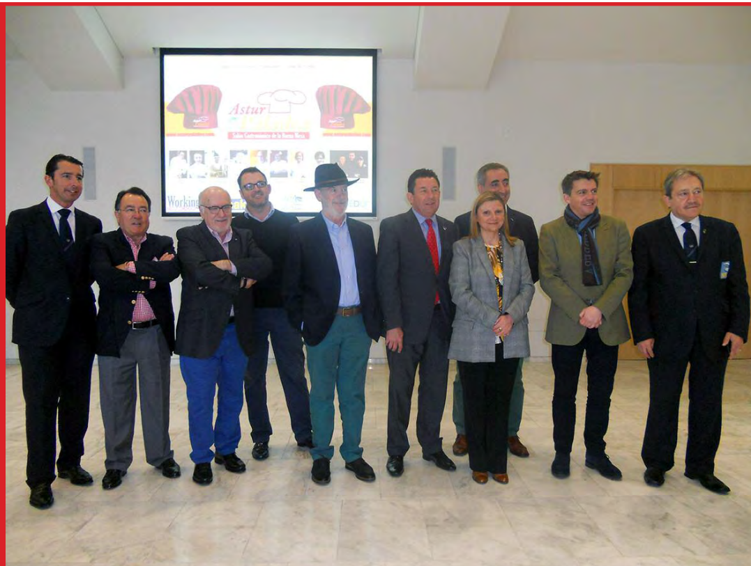
Momento de la inauguración de la pasada Edición de AsturPaladea. Sala de Cristal del Palacio de Congresos “Ciudad de Oviedo”

AsturPaladea tiene como objetivo ser el mejor escaparate, el referente en el Norte de España, de los productos de alta calidad que conforman la buena mesa, un Certamen Gastronómico donde poder interactuar con los profesionales del sector de la alimentación, bebidas y equipamientos.